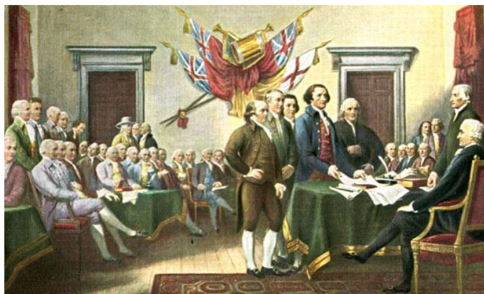
Sottoscrizione della dichiarazione d'indipendenza degli Stati Uniti d'America, Filadelfia 4 luglio 1776 (Affresco al Campidoglio di Washington nella Sala dell'Indipendenza)

La causa prima della dichiarazione dell'indipendenza fu una proposta del 7 giugno 1776 dei rappresentanti dello Stato della Virginia, chiedente che il congresso proclamasse le colonie unite Stati liberi e indipendenti. L'8 giugno fu rimandata la definitiva risoluzione intorno a questa proposta al 1° luglio, ma al tempo stesso venne eletta una commissione, perchè preparasse la dichiarazione dell'indipendenza; commissione composta di G. Adams, dr. Franklin, Tommaso Jefferson, Ruggero Sherman e Roberto R. Livingston. Il compilatore della dichiarazione è il Jefferson, la minuta del quale con alcune correzioni, venne presentata al congresso (la minuta-bozza la riportiamo sopra) che riprese il 1° luglio la discussione su quel soggetto, e la sera del 4 approvò la dichiarazione dell'indipendenza. Essa fu sottoscritta, lo stesso giorno, solo dal presidente Giovanni Hancock; e dai rimanenti più tardi. Nel 1789 la dichiarazione dell'indipendenza fu depositata nel « Dipartimento degli affari esteri », che oggi si chiama « dipartimento di Stato », dove adesso si trova in uno stipo di acciaio. Il documento è scritto su pergamena che qui riproduciamo interamente digitalizzato. Dandone poi in fondo la traduzione e le firme leggibili.