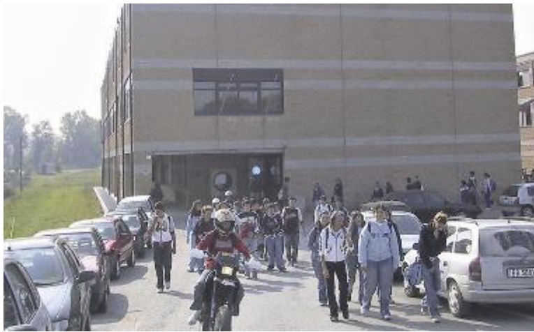
Il Marie Curie svolge varie iniziative per la formazione dei ragazzi